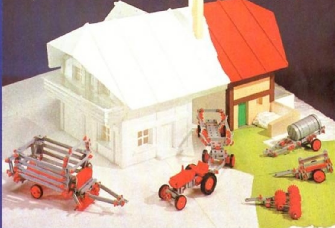
Jetzt zum Traktor den Bauernhof