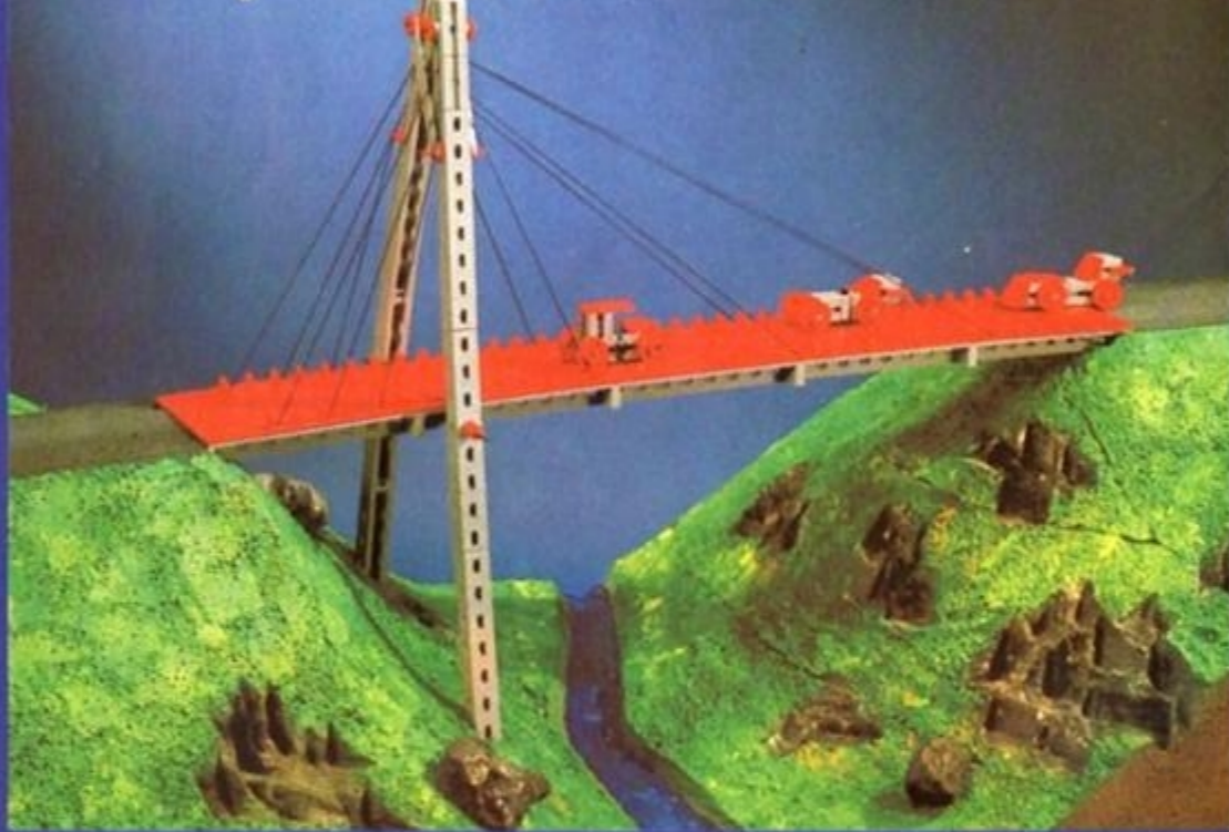
Jetzt zur Brücke den Fluß