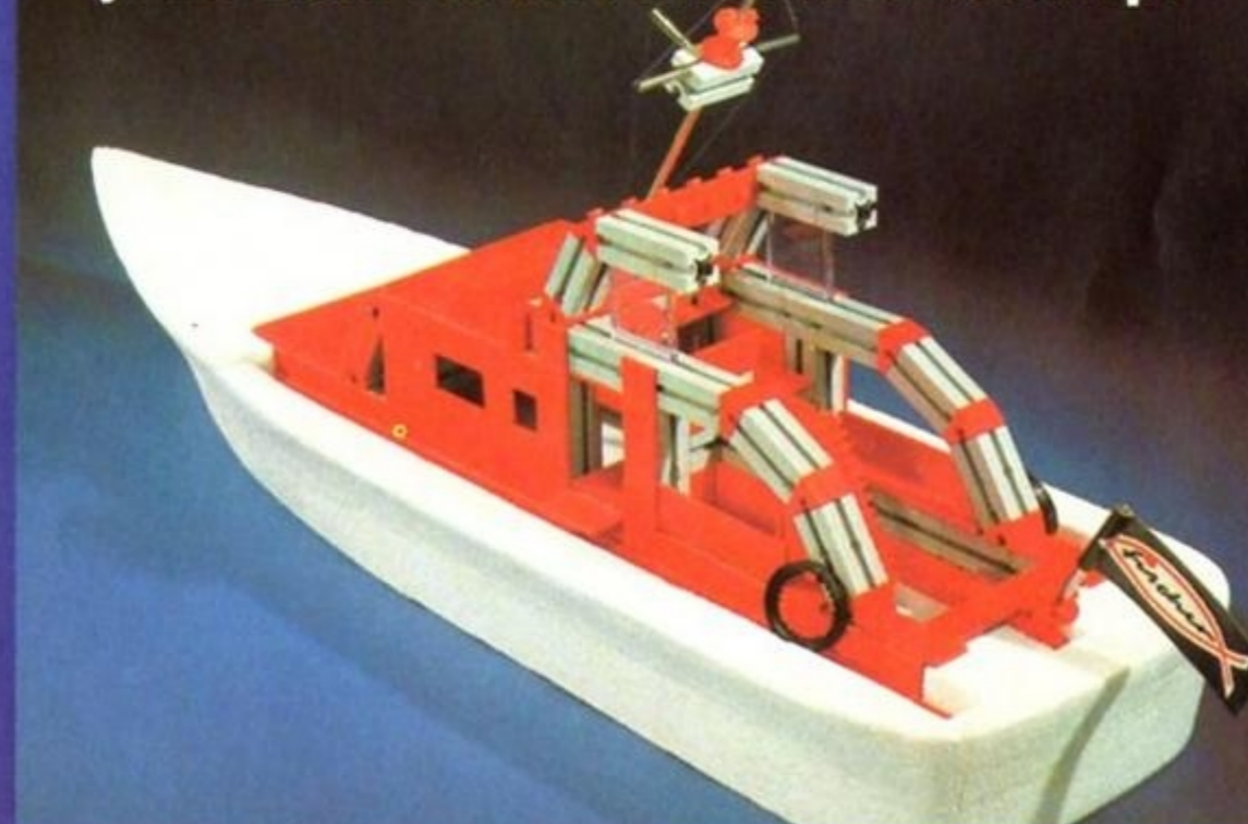
Jetzt zum Bootsdeck den Bootsrumpf