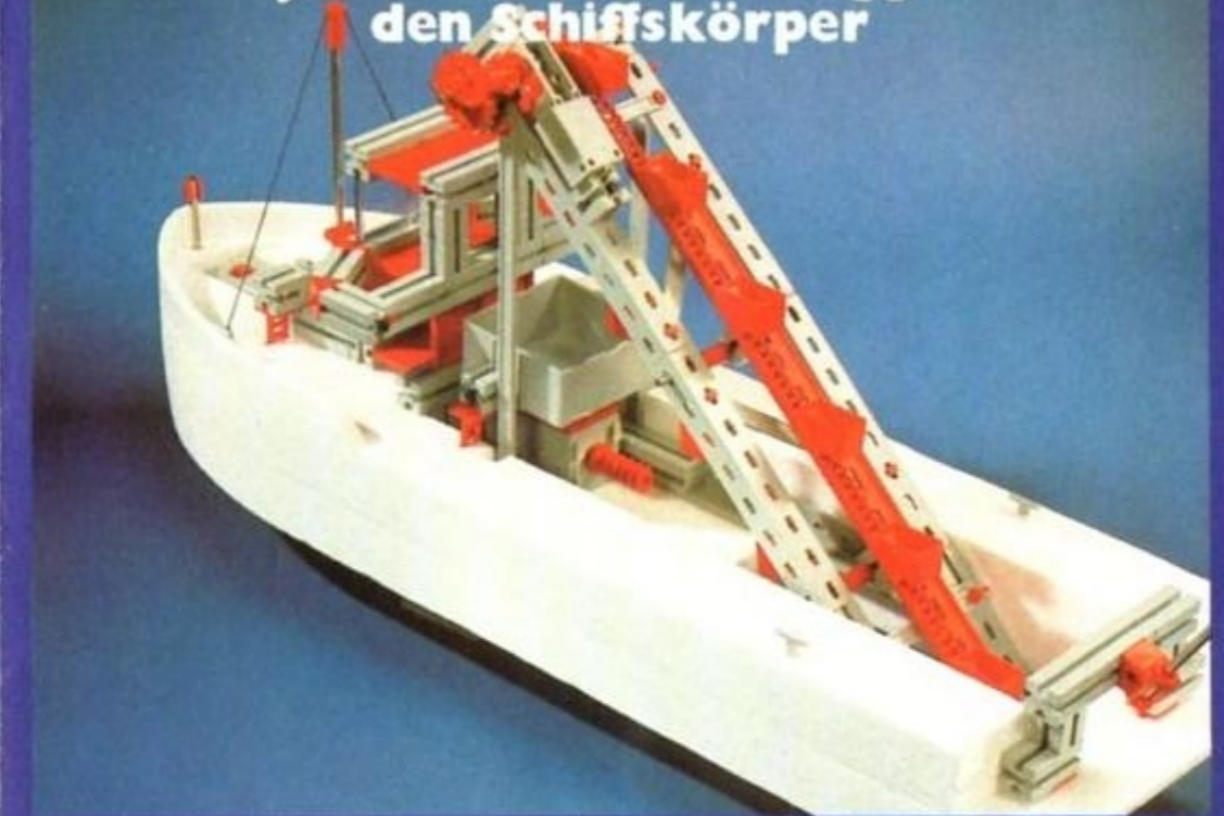
Jetzt zum Förderbagger den Schiffskörper